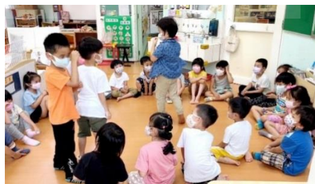
►不管是觀眾或演員，大家都很投入在故事說演的活動中 （照片截錄自協會第 16 期電子報）