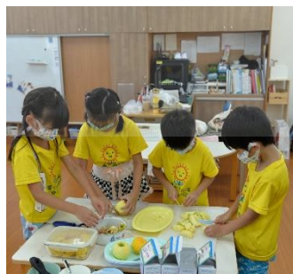
▶ 孩子們合作準備食材與烹飪