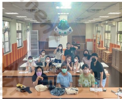
▶實際應用拍攝角度技巧合照（手機拍攝）