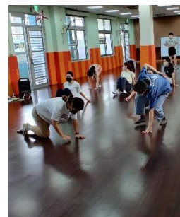
▶學員們配合音樂，發揮創意靈活運用身體完成指令動作