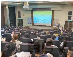
►我和我的朋友主題課程分享

在今年的年會中，協會邀請了國立臺灣師範大學人類發展與家庭學系賴文鳳教授進行主題演講（主題：「看山又是山」：聆聽孩子的故事/看見自己的教學），也邀請臺北市立大同幼兒園、臺北市吉利非營利幼兒園和故事說演工作室黃又青老師，從三個不同角度分享文化課程，分別為「打鐵街在地文化課程」、「我和我的朋友主題課程」以及幼兒的故事說演。最後，邀請當天主題演講講者、各場次的講者、與談人及臺北市立大學幼兒教育系幸曼玲教授針對「孩子的故事與幼兒園的文化課程」進行深度對話。當天與會者經驗了一場深刻的文化饗宴。