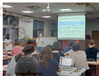
▶ 向陽教學組長分享進行評量