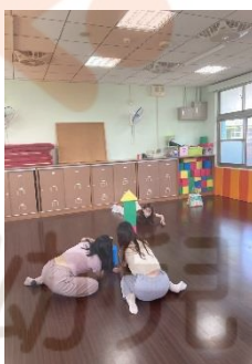
▶現場練習不同角度實拍