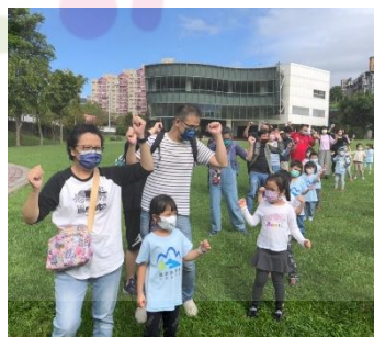
▶ 大家一起跟著動一動、扭一扭