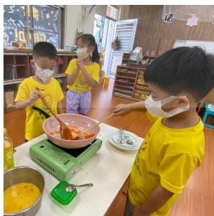
▶ 孩子從準備食材到烹飪，自製畢業餐會餐點

畢業典禮當天上午，孩子們著手準備畢業餐會的餐點，在準備的過程中，孩子們體會到：「我長大了！」、「我會做很多事情！」、「我可以！」當天下午畢業典禮，家長來參與並為孩子別上畢業生的胸章，一同與孩子慶賀畢業並開啟另一個學習旅程。