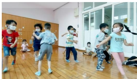
►故事說演已成為孩子們每天最期待的活動之一

參與的學員表示，透過讓幼兒自己說演故事，除了能【看見】孩子的想法外，也讓一些平常不發聲、少參與的孩子開始主動表達（此活動的學員心得發表於第 16 期電子報。）