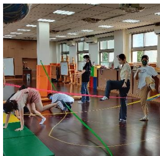
▶學員嘗試運用肢體動作穿越不同素材所搭建出的空間