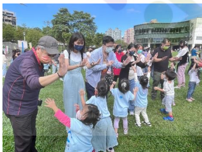
▶ 跟著老師一起拍拍手

在大湖公園的這一天，孩子與家長一起散步、一起遊戲、一起歡笑、一起享受最和諧的親子關係。