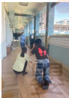
▶現場練習距離取景實拍

參與的學員不僅認識攝影的技巧，也學習事先思考拍攝的主題及構思希望透過照片傳遞的意念，藉由拍攝，讓觀賞者在欣賞照片的同時感受到攝影者想傳達的想法。