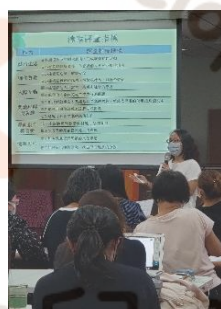
▶ 向陽園長分享如何進行檔案評量