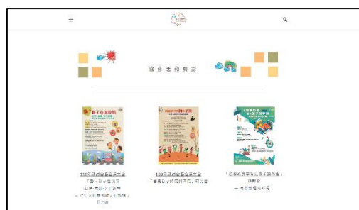
▶ 活動剪影頁面，改以圖像呈現方式，更易閱覽