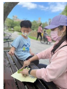
▶ 親子一起找到五種不一樣形狀的葉子