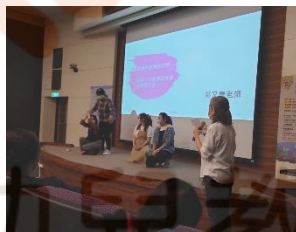
►故事說演現場參與