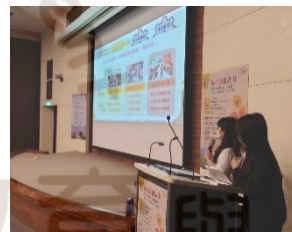
►打鐵街在地文化課程分享