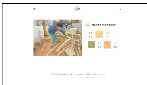
▶ 首頁展現出協會理念「優質教保、看見孩子、平等尊重、文化回應」協會網頁首頁

在首頁呈現協會的理念，運用明亮、清新的色調讓人留下印象，並以圖文並茂的排版與設計，藉由圖像列表的呈現方式，讓瀏覽者更容易閱覽網頁。